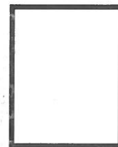
Huella Digital (índice derecho)